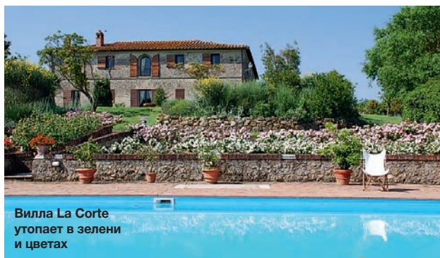
Вилла La Corte утопает в зелени и цветах