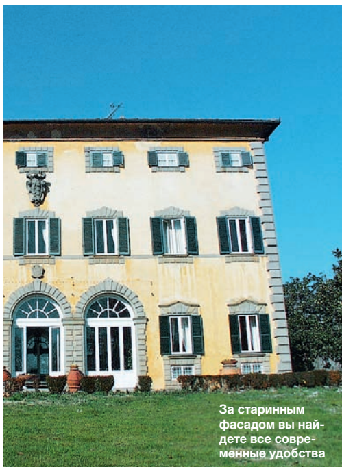
За старинным фасадом вы найдете все современные удобства