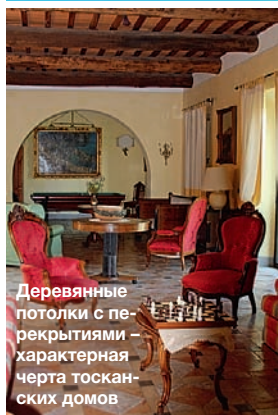
Деревянные потолки с перекрытиями характерная черта тосканских домов