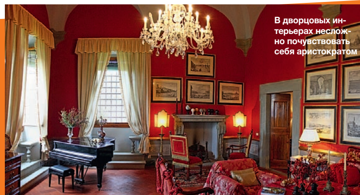
В дворцовых интерьерах несложно почувствовать себя аристократом

рических гостевых дома – на 8, 6 и 6 персон.